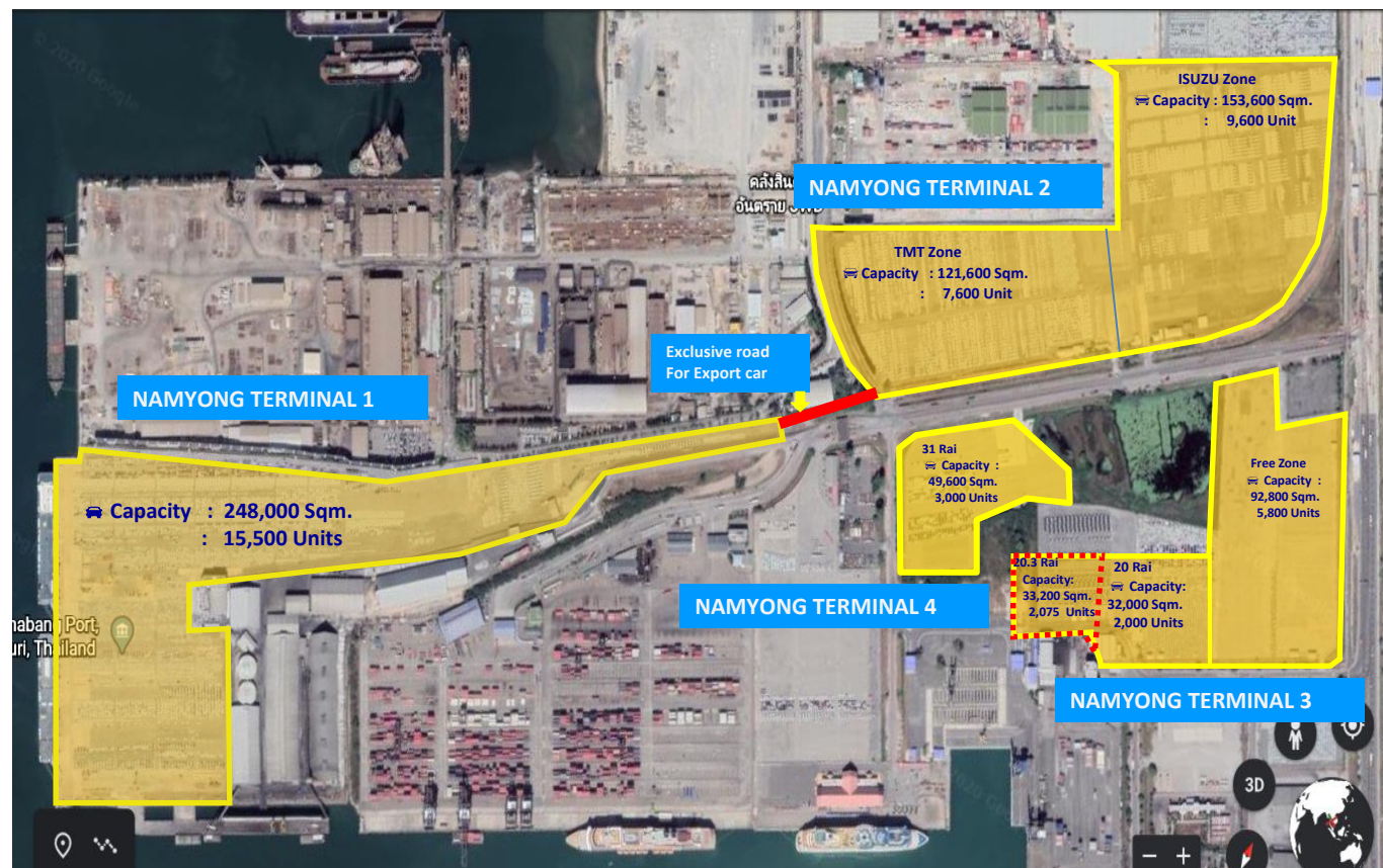
รูปที่ 1.3-2 การใช้ประโยชน์พื้นที่โครงการในส่วนพื้นที่รับสินค้า (บริเวณพื้นที่หลังท่า)